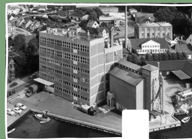
2007 Havremølle og Gule Ærter ® produktion i Svendborg købes