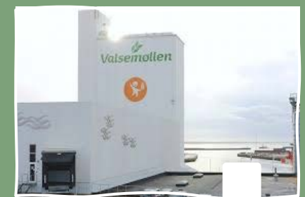
2011-2016 Nye produktions- og lagerbygninger i Køge og Esbjerg