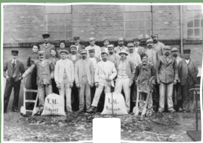
1899 Valsemøllen etableres på Esbjerg havn

Vi producerer årligt ca. 160.000 tons færdigvarer: Mel, melblandinger, havregryn, frø og kerner m.m.